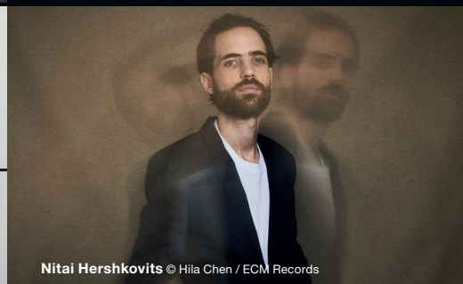
Nitai Hershkovits